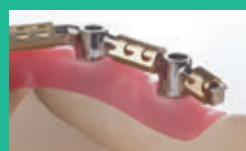
Barra em U Dolder®