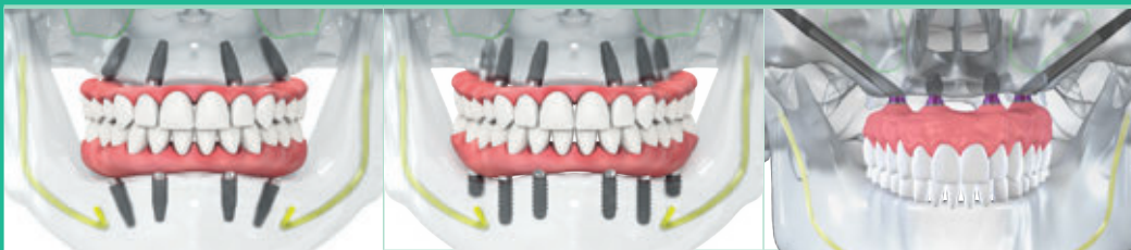
Straumann® Pro Arch com implantes BLT, BLX e TLX