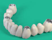
Barra fixa básica